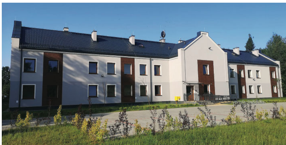
Budynek socjalny na ulicy Nidzkiej

Przeprowadzono m. in. termomodernizację budynku Administratora, czy termomodernizację budynku mieszkalnego na Sienkiewicza 17.