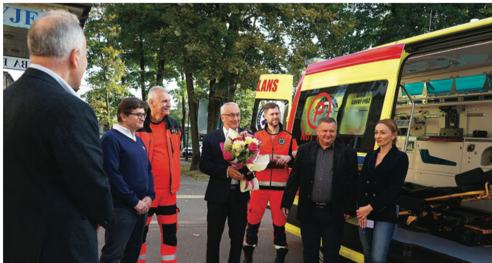
Przekazanie kluczyków do karetki