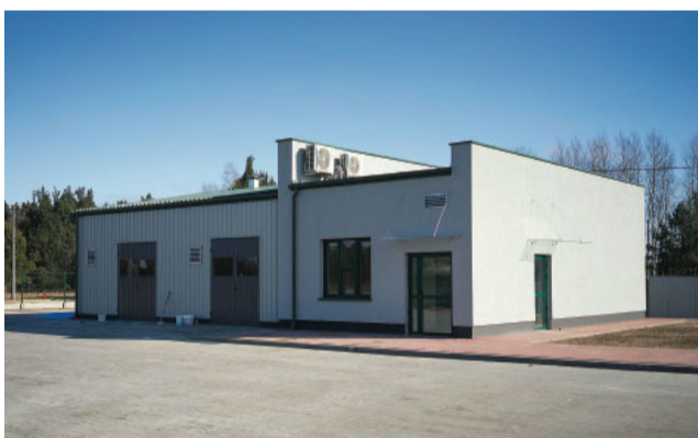
PSZOK w Pisz