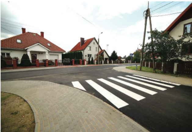
Jedna ze zmodernizowanych ulic w Pisz

— To prawda, kiedy w 2014 r. wygrałem wybory samorządowe i obejmowałem fotel burmistrza, Gmina Pisz była w oplakanej sytuacji finansowej. Byliśmy jedną z najbardziej zadłużonych gmin w Polsce. Rok 2014 kończono z aż około 100 milionowym długiem, biorąc pod uwagę również odsetki i inne wymagalne należności, a w scenariusz wyjścia z zapaści finansowej trudno było uwierzyć. Czasem opowiadam taką anegdotę, że gdyby dług był smokiem, a ja sam rycerzem, który tego smoka pokonał, to byłbym bohaterem, a tak mam wrażenie, że wielu ludzi nie rozumie i nie docenia ogromu pracy jaką trzeba było włożyć,