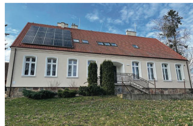
Szkoła w Kotle Dużym

— W świetle przepisów tylko jeszcze jedną kadencję mógłbym sprawować tę funkcję. Jeśli zostanie ponownie wybrany na fotel Burmistrza Pisz planuję dokończenie wielu rozpoczętych działań, doprowadzenie do realizacji budowy obwodnicy Pisz oraz stopnia wodnego na rzece Pisie, a także innych projektów i inwestycji służących rozwojowi gminy.