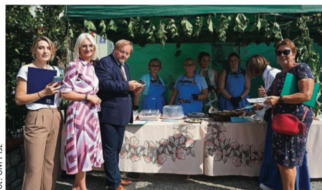
KGW z Kociołka Szlacheckiego

- „Małe Granty Sołeckie Marszałka Województwa Warmińsko-Mazurskiego” w 2024 r. dla Sołectwa Pietrzyki na zadanie inwestycyjne „Strefa relaksu i integracji w Pietrzykach”. Kwota otrzymanego dofinansowania to 25 000 zł. Koszt całkowity zadania 50 000 zł. - „Granty Marszałka dla Kół Gospodyń Wiejskich”