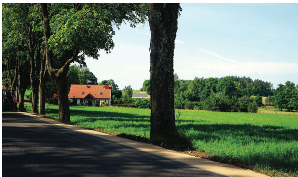
Droga Maszty - Pietrzyki