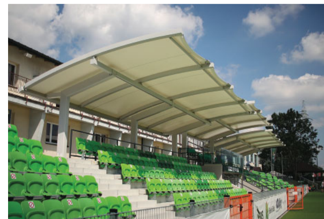
Tak będzie wyglądało zadanie stadionu miejskiego na ul. Mickiewicza w Pisz