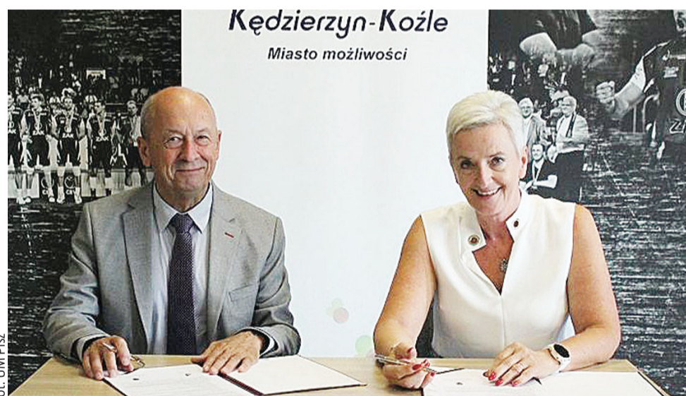
fot. UM Pisz

Jestem wdzięczny panu burmistrzowi Januszowi Puchalskiemu za te dwie kadencje wspólnej pracy nad rozwojem Gminy Pisz. Za podjęcie wyzwania w trudnej sytuacji w jakiej znajdowała się nasza gmina. Wspólnie udało nam się spłacić zadłużenie. Pan Puchalski zapisał się w tym najtrudniejszym czasie zło-